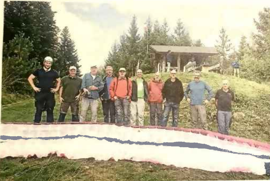
Das „Pflege-Team“ richtete den Gleitschirm-Startplatz vorbildlich her.

Hierbei geht eine große Bitte an die Wanderer: Diese empfindliche Fläche sollte vorerst nicht betreten werden. Übrigens: Über Zuspruch und Fragen bei den Starts der Gleitschirmflieger freuen sich die Piloten sehr. (wa/red)